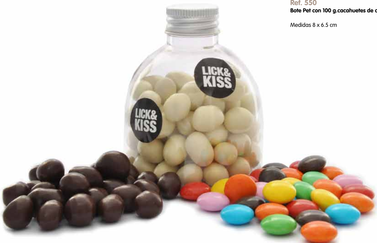
Ref. 550 Bote Pet con 100 g.cacahuets de chocolate.