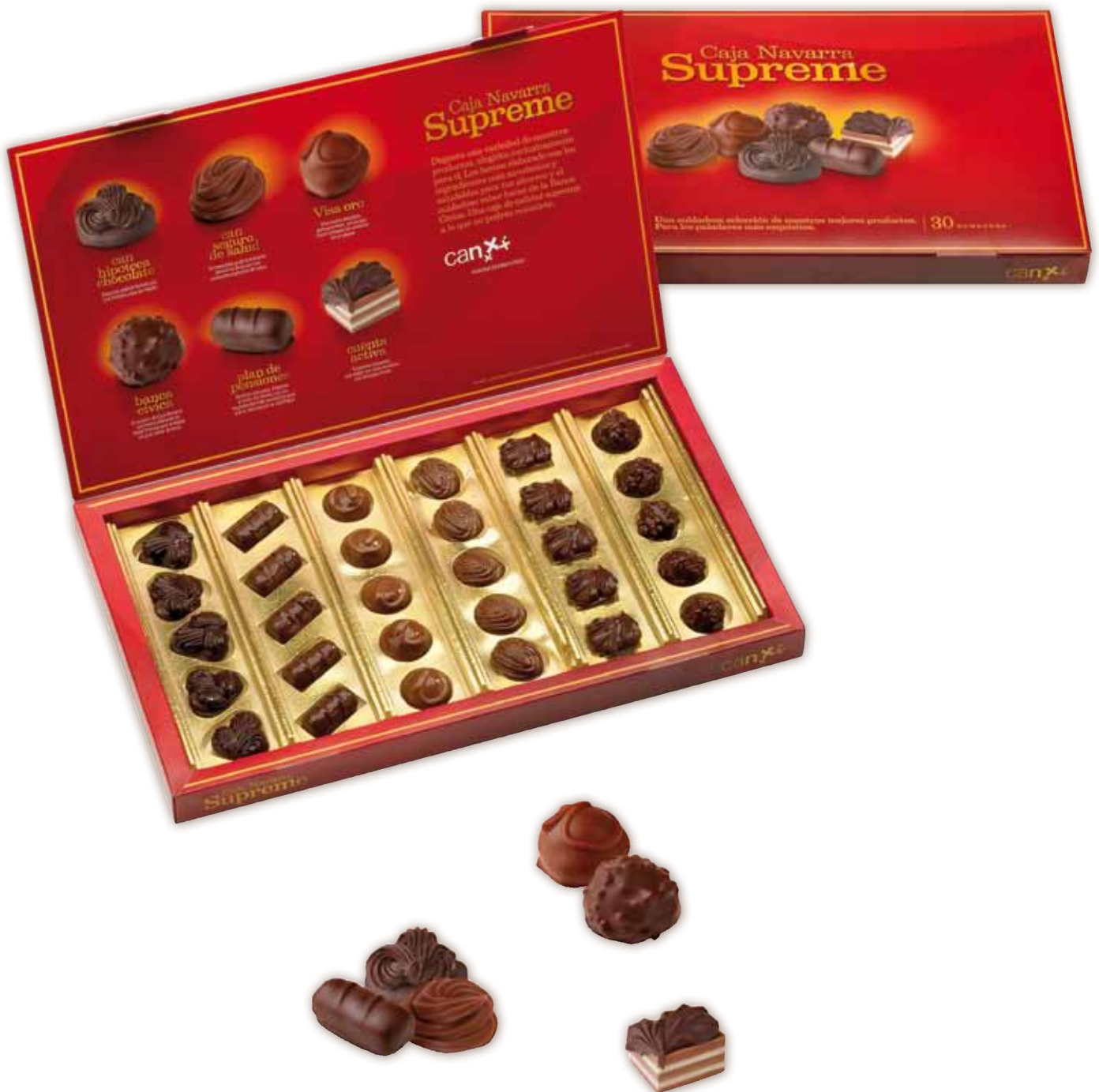
Ref. 570 Estuche Navarra con surtido de bombones artesanales.