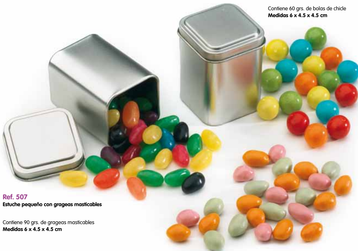
Ref. 507 Estuche pequeño con grageas masticables

Contiene 60 grs. de bolas de chicle Medidas 6 x 4.5 x 4.5 cm