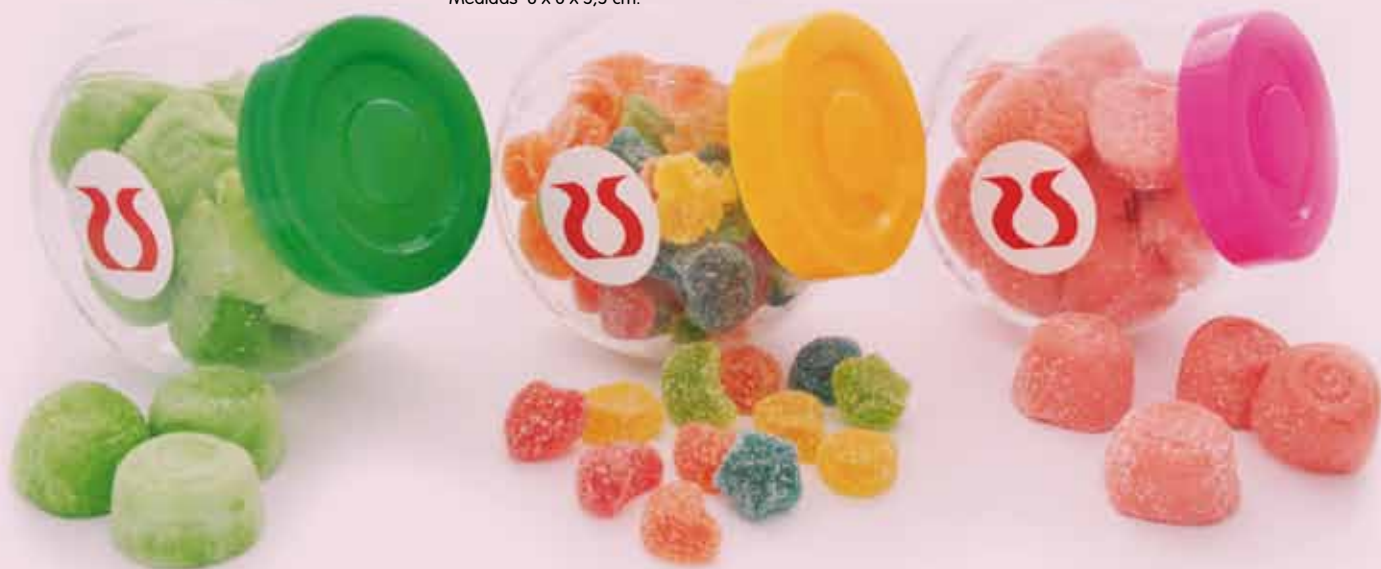
Ref. 301 Bote de cristal con gominolas Medidas 8 x 6 x 5,5 cm.