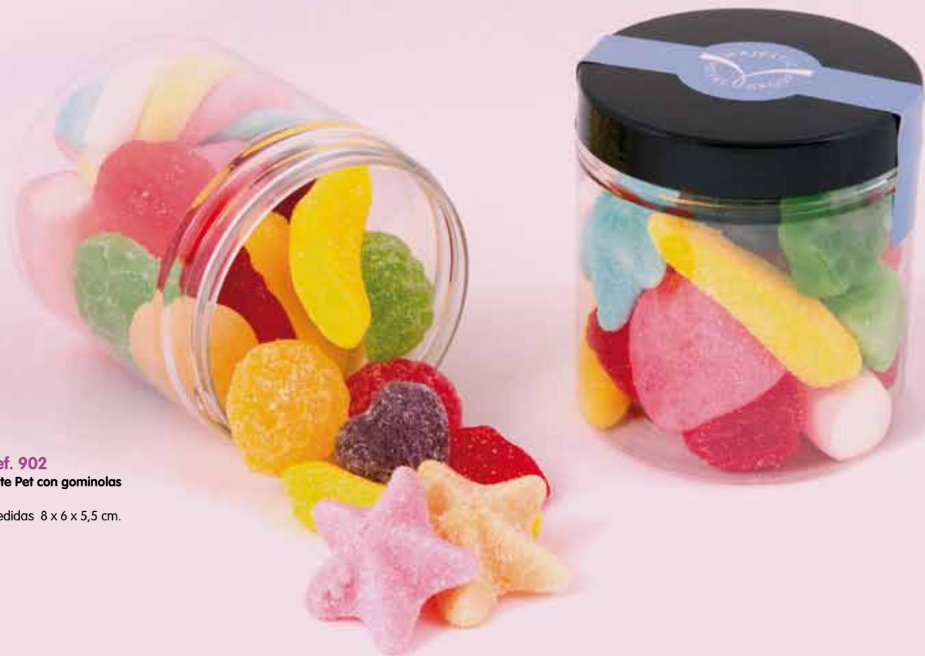
Ref. 902 Bote Pet con gominolas Medidas 8 x 6 x 5,5 cm.