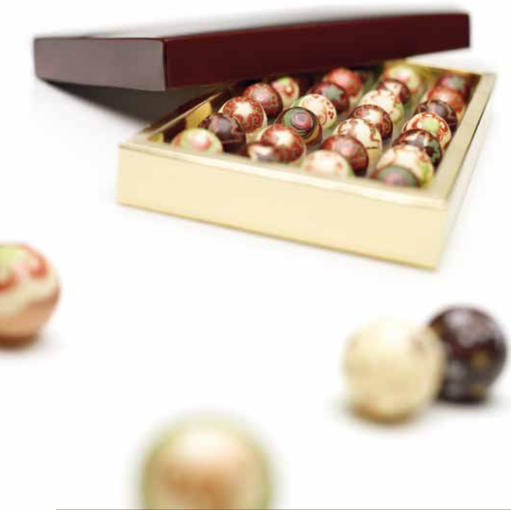
Ref.562 Bote de Cristal con bolas de chocolate