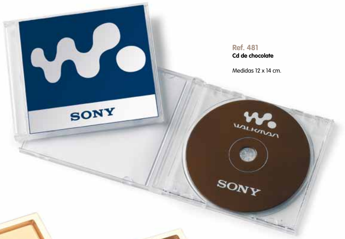
Ref. 481 Cd de chocolate