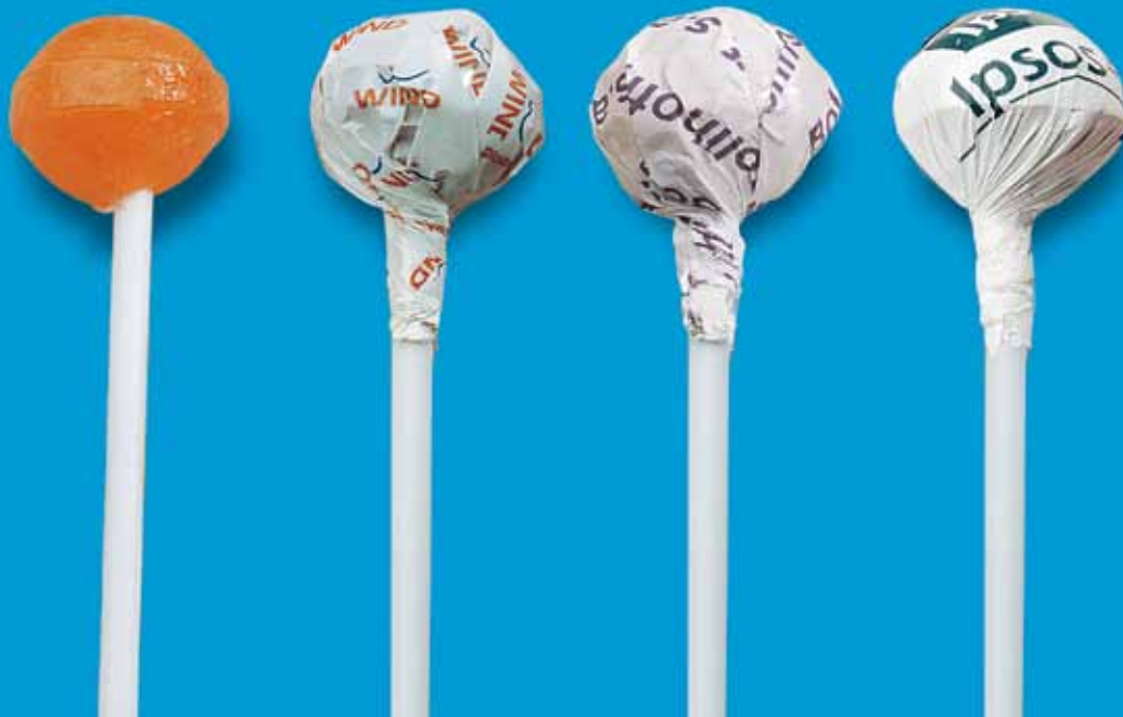
Ref. 166 Piruleta forma especial 3D