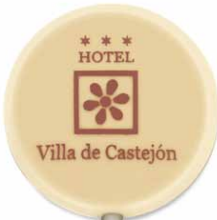
Ref. 283 Chocolatina Redonda