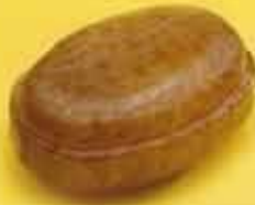
Ref. 102 Caramelo Zeppeling